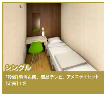
シングル 【設備】羽毛布団、液晶テレビ、アメニティセット 【定員】1名