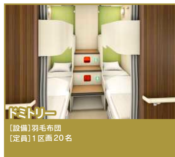
ドミトリ 【設備】羽毛布団 【定員】1区画20名