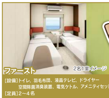
ファースト 2名1室1ベッド 【設備】トイレ、羽毛布団、液晶テレビ、ドライヤー 空間除菌消臭装置、電気ケトル、アメニティセット 【定員】2～4名